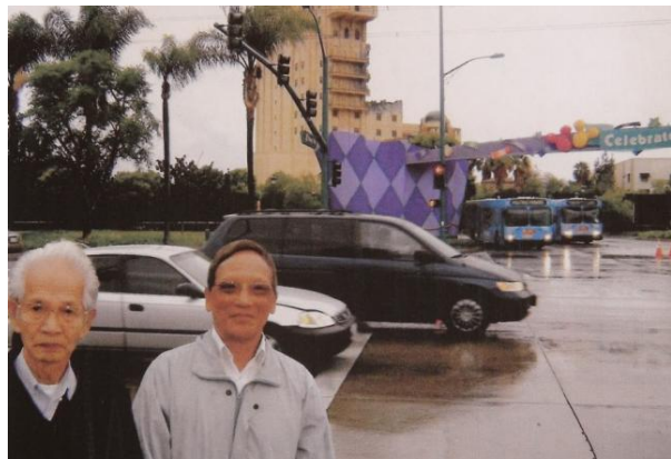
Các AH Lâm Viên, Từ-đình-Lu