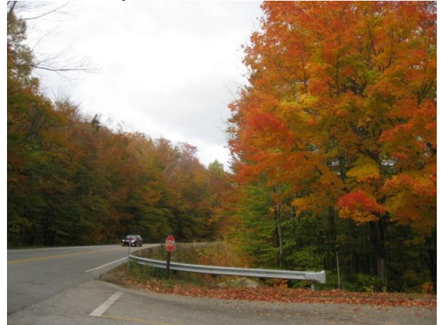
Rừng thu thay lá hai bên xa lộ Kancamagus trong vùng Núi Trắng

Từ Conway, đi về hướng nam theo xa lộ số 16 một khoảng ngắn, chúng tôi rẽ phải vào đường 112 tức là Kancamagus Highway. Con đường uốn lượn theo sườn đồi và bắt đầu lên dốc. Chỉ 5 phút sau chúng tôi đã thấy bảng chào mừng du khách vào thăm đoạn đường đẹp nhất nước Mỹ.