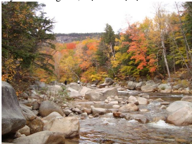
Dòng sông Swift trong mùa thu lá vàng

Kancamagus Highway có hai làn xe với chiều dài 34,5 km (khoảng 55 km) len lỏi trong khu rừng Núi Trắng (White Mountain). Xa lộ này được khánh thành năm 1959 nối liền hai thị trấn Lincoln và Conway. Từ đó đến nay, nơi đây đã trở thành một địa điểm du lịch nổi tiếng. Đặc biệt là vào mùa thu, khi thiên nhiên thay áo mới, thì nơi đây thu hút rất nhiều người đến ngoạn cảnh, chụp hình. Thời gian du khách tới đây nhiều nhất chính là vào cuối tháng 9, đầu tháng 10 khi rừng thu thay lá. Lúc đó khu vực này sẽ rất đông đảo, thậm chí bị kẹt xe.