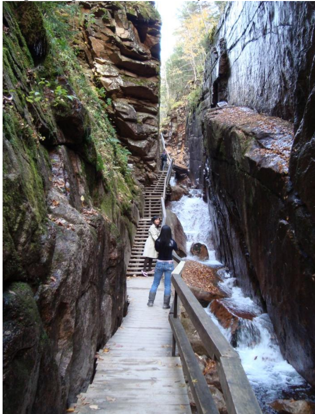
Flume Gorge, dòng suối nằm giữa hai vách đá thẳng đứng

Xuống trạm xe buýt, chúng tôi thấy có một con suối từ một thác ở trong núi chảy ra. Dòng suối chảy uốn lượn trên các lớp đá trông rất đẹp. Đường dốc dần lên. Chúng tôi men theo bờ suối để đi về phía thượng nguồn. Đường hơi dốc nên khó đi. Trời khá lạnh. Chúng tôi vừa đi vừa ngắm cảnh, chụp hình nên không thấy mệt lắm. Chưa tới “Flume” mà phong cảnh ở đây đã quá đẹp vì có suối, có thác, có đá, có cây cao bóng mát, có rừng phong lá vàng, lá đỏ ... Trời đã về chiều nhưng ánh sáng cũng còn đẹp đủ để chụp những tấm ảnh thật vừa ý.