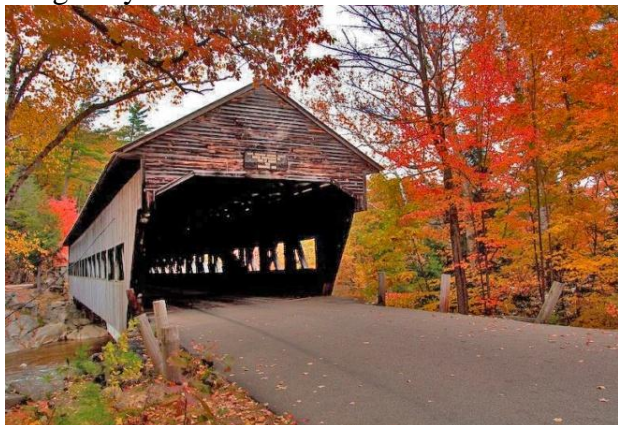
Cầu Albany với mái che trong khu Núi Trắng (hình từ internet)

Tôi chỉ tiếc là mình đã thiếu tìm hiểu trước để có thể đến xem một chiếc cầu có mái che tên là cầu Albany bắc ngang sông Swift. Theo bản đồ, chiếc cầu này cũng dễ tìm và cũng là một địa điểm du ngoạn lý thú mà tôi đã vô tình bỏ sót trong chuyến đi.