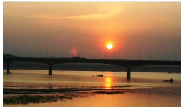
Chiếc Cầu Mối Sông Trà Khúc

Sau cơn lụt tôi không gặp lại các bô lão trong làng và tôi cũng không nghe dân chúng nhắc đến chuyện liên hệ giữa “đầu rồng” bị cắt do công tác làm cầu Trà Khúc và sự thiệt hại do bão lụt gây nên.