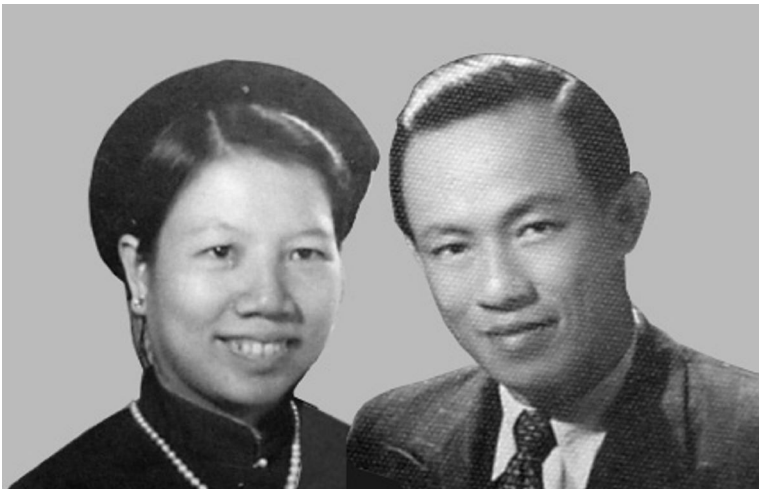
(Ngày cưới -1934)