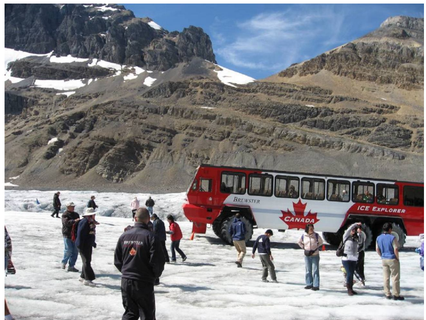
Du khách đang hớn hờ dạo chơi trên băng hà Athabasca. Xa xa là chiếc xe đặc biệt để di chuyển trên nước đá.