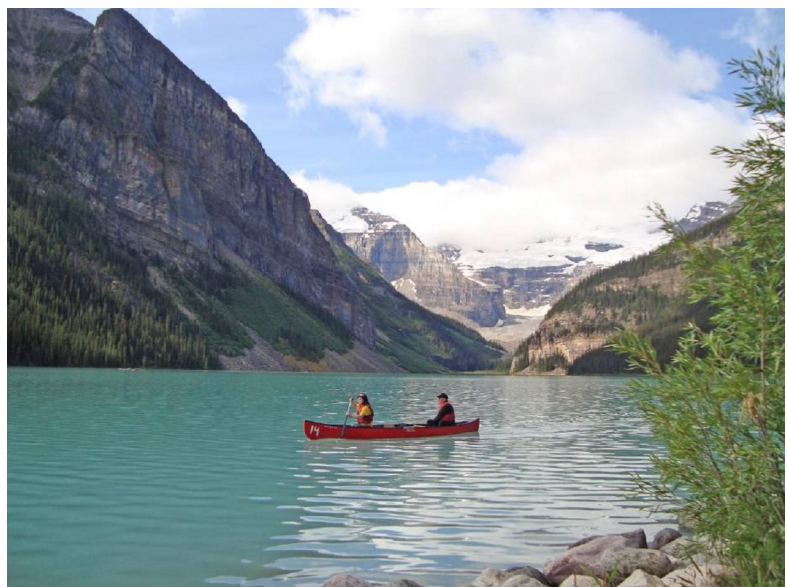
Hồ Louise nước xanh như ngọc

Hồ Louise là một hồ trên núi cao. Cao độ quanh vùng vào khoảng 1.530 mét nên nơi đây tự hào là khu vực có người ở cao nhất Canada. Hồ không lớn lắm nhưng nước hồ đẹp tuyệt vời. Nó có màu xanh nhạt giống như cẩm thạch. Hai bên nam bắc là hai đỉnh núi cao có tuyết phủ. Xa xa về phía tây là băng hà Victoria trắng xoá. Quanh bờ hồ có đường đi bộ để du khách dạo chơi và từ đó có thể nhìn ngắm một