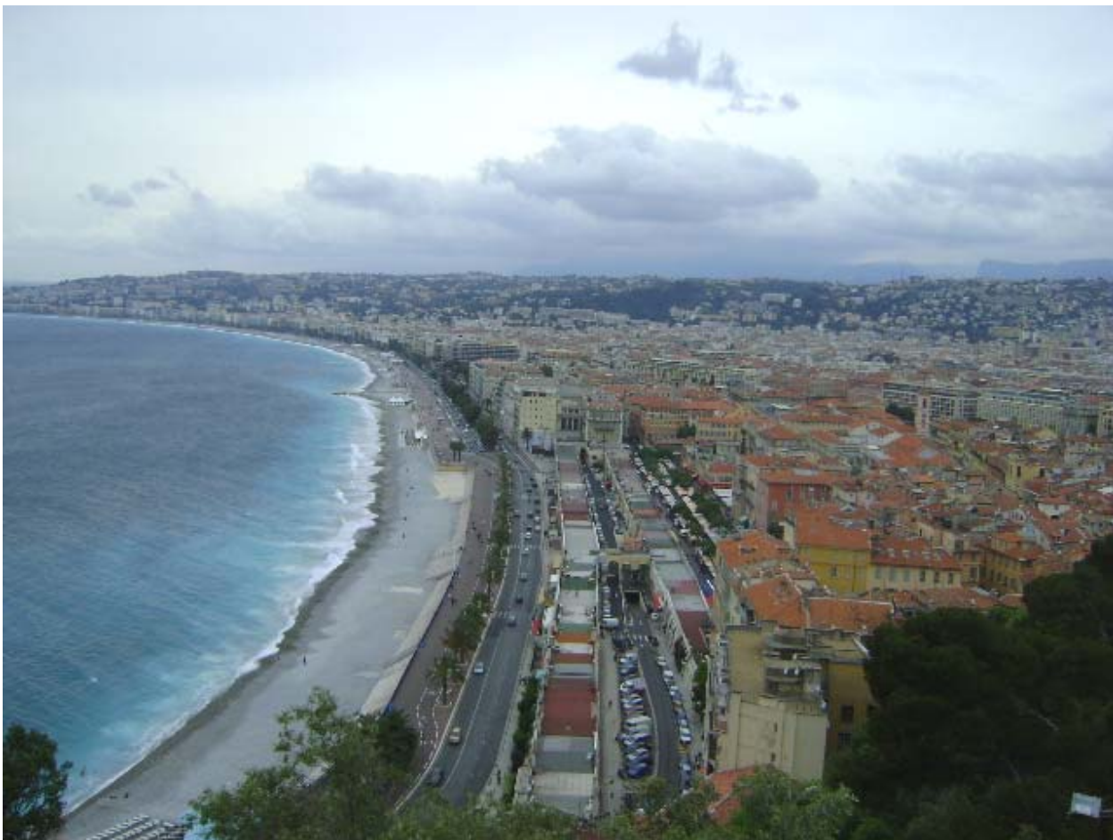
Thành phố Nice từ trên đồi cổ thành nhìn xuống