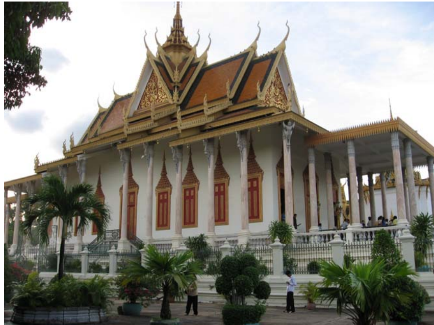
Chùa Vàng Chùa Bạc trong Hoàng Cung Nam Vang

Phật của Thái Lan. Năm 1962 chùa đã được trùng tu. Dưới thời Pol Pot, chùa được bảo tồn tuy rằng 60 % hiện vật đã bị mất. Trong chùa có một tượng Phật đứng làm bằng vàng tạc năm 1906, nặng 90 kg và có gắn 9584 viên kim cương. Viên lớn nhất nặng 25 cara. Bên trên còn có tượng Phật, ngồi cao chừng 30 cm, làm bằng ngọc xanh. Hiện giờ trên thế giới chỉ