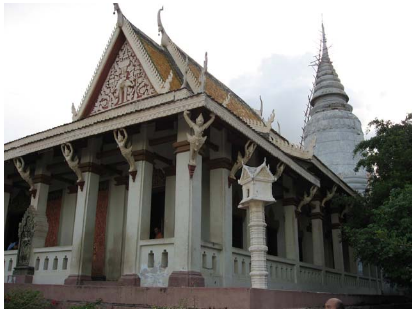
Chùa Bà Penh

Ở phía Nam chùa có một tiệm bán đồ lưu niệm và một căn nhà với kiến trúc tiêu biểu của dân tộc Khmer. Bên cạnh đó là nhà triển lãm về ngoại giao của hoàng gia. Ta sẽ thấy hình vua Sihanouk bắt tay các lãnh tụ trên thế giới cả phe tả lẫn phe hữu. Trên đường ra là nhà triển lãm lễ đăng quang của vua mới: Norodom Sihanmoni. Ông này là con thứ của Sihanouk nhưng có số làm vua vì ông anh cả, là hoàng thân Ranarith, muốn làm chánh trị nên có đảng riêng. Vua Campuchia chỉ có hình thức và nghi lễ mà không có thực quyền nên không được làm chánh trị. Vua Sihanmoni hiện còn độc thân. Vua Sihanouk có rất nhiều con và con của ông chỉ học ca, vũ, nhạc, kịch ... nghĩa là các món ăn chơi chứ không học văn hoá, quân sự, hay chánh trị. Vua Norodom Sihanmoni hiện nay là một vũ sư có tài còn chị của ông là công chúa Norodom Buppha Devi cũng là một vũ sư nổi tiếng về vũ apsara của dân tộc Khmer.