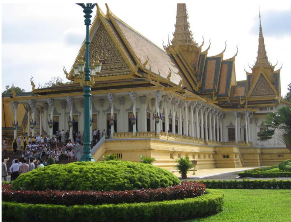
Cung điện Hoàng Gia Campuchia

Hoàng cung Phnom Penh là nơi cư ngụ của hoàng gia Campuchia. So với triều Nguyễn ở