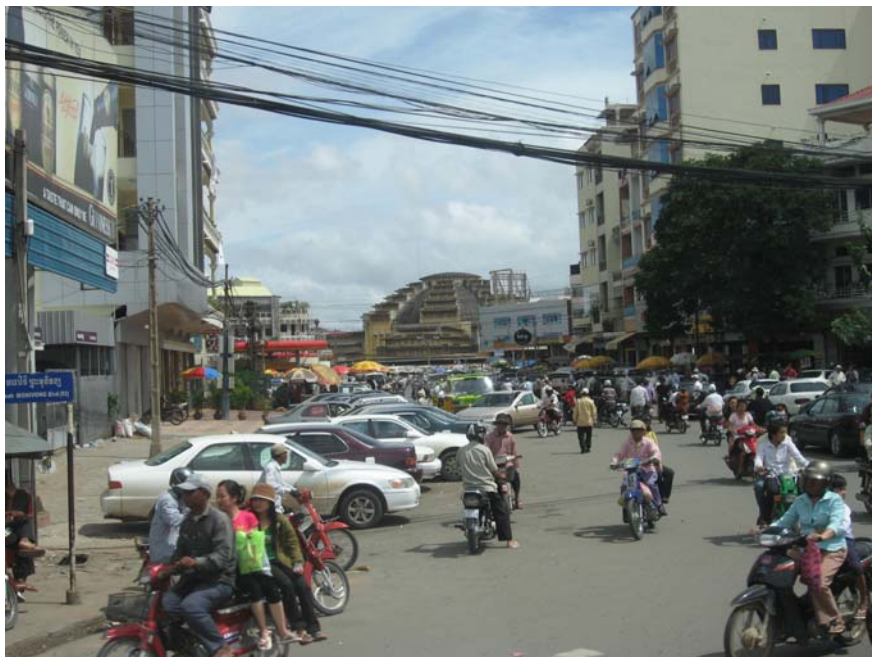
Đường phố Nam Vang gần khu Chợ Mới

Nhà cửa ở Phnom Penh giống như thành phố Chợ Lớn với rất nhiều bảng quảng cáo. Đầu tiên, chúng tôi thấy có một vòng xoay rất