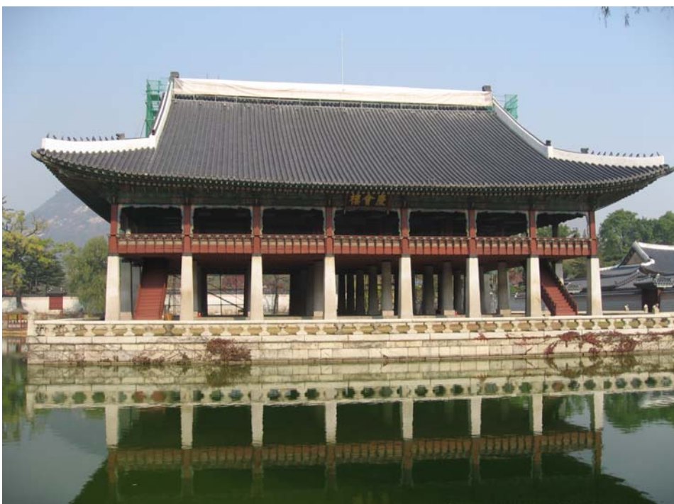
Lầu Khánh Hội nơi đãi tiệc của hoàng gia

Cung Cảnh Phúc thể hiện chủ quyền của nhà vua trên đất nước Triều Tiên. Qua dòng lịch sử, cung này bị tàn phá nhiều lần nên ngày nay không còn lại bao nhiêu kiến trúc. So với