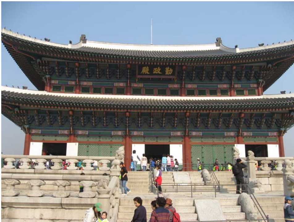
Điện Càn Chánh

Sau Hưng Lễ Môn, qua một cây cầu đá là Càn Chánh Môn (Cổng Càn Chánh Geunjeongmun - chữ mun có nghĩa là môn : cổng). Qua khỏi cổng chúng tôi bước vào khu vực dành riêng cho nhà vua, có tường ngăn bao bọc. Kinh thành này có nhiều lớp tường, từ đây