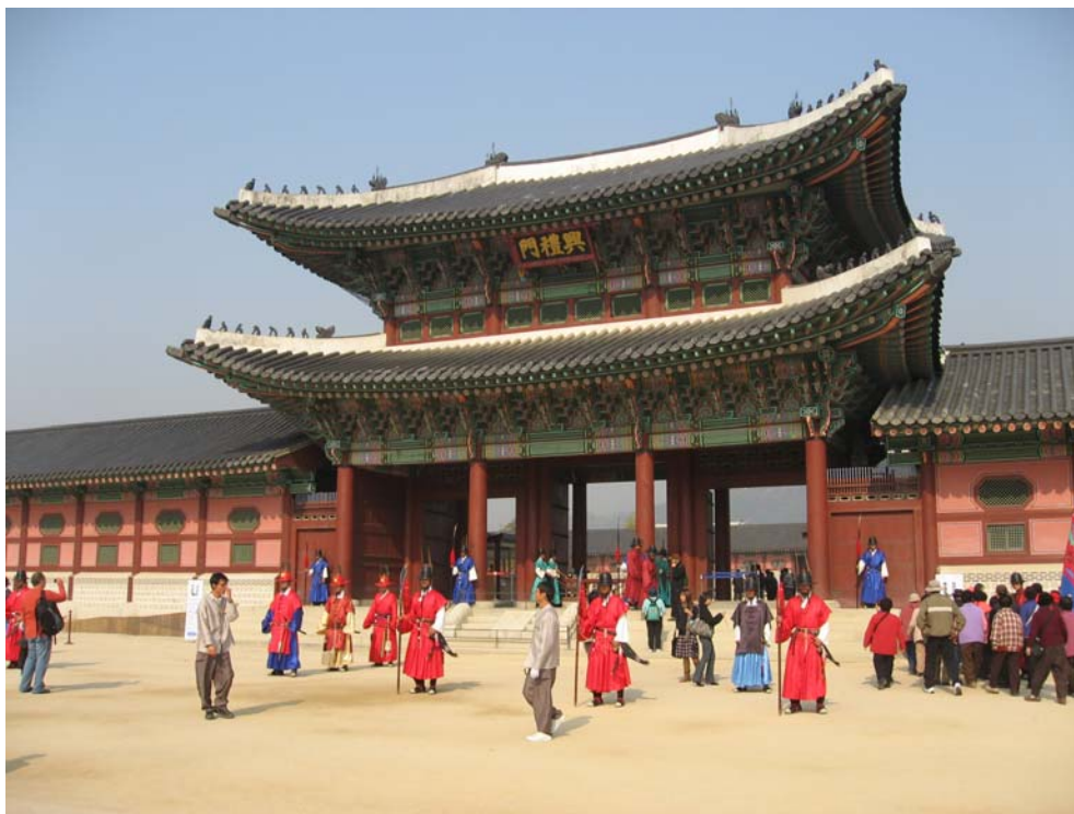
Toán thị vệ đang gác trước cổng Hung Lễ