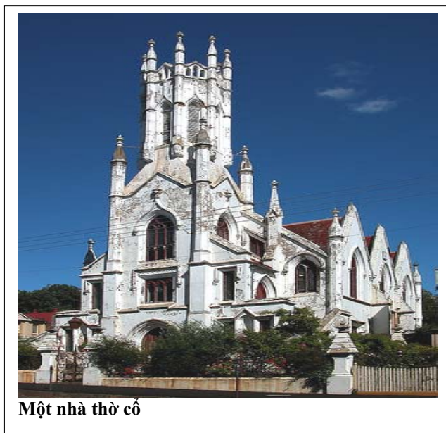
Một nhà thờ cổ

nhận thấy qua đường sá sạch sẽ, vườn tược ngăn nắp, nhà cửa khang trang, con người ăn mặc, đi đứng, nói năng lịch sự và có nhiều xe hơi đời mới bóng loáng, nhưng đặc biệt là họ có vẻ trân trọng các giá trị của thời quá khứ. Không biết bên trong phòng ốc biến đổi như thế nào chớ bên ngoài, từ hàng hiên đến mái nhà, những nét của thời cũ vẫn còn nguyên vẹn. Năm 1821 Toàn quyền Macquarie của NSW kinh lý nơi này và khởi đầu cho việc phát triển với việc xây các đập nước Toom Kake và Long Marsh, xây cầu Ross ba nhịp vào năm 1836, xây khách sạn Scotch Thistle năm 1840, xây nhà thờ Anh Giáo năm 1869... Những công trình kiến trúc này phần lớn được xây bằng sa thạch (sandstone), do công sức của tội phạm, vẫn được bảo trì nguyên vẹn đến ngày nay và hiện trông rất mỹ thuật.