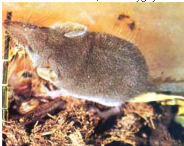
Chuột Savi's Pygmy Shrew

Chuột săn mồi lớn hơn nó: là chuột châu chấu ở Úc Ingram's planigale ( planigale ingrami ) thân chỉ dài từ 2.3 đến 3.5 inches, nặng cỡ 5 grams nhưng có thể xoi châu chấu lớn bằng thân nó. Với đầu nhọn chúng có thể đút đầu vào những kẽ nứt để bắt mồi. Mỗi ngày chúng xoi từ 6 đến 8 con châu chấu.