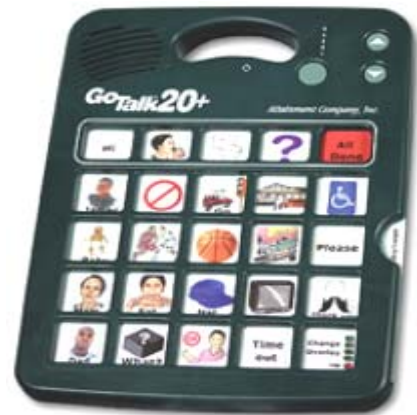
Máy trợ giúp bệnh nhân nói chuyện với nút bấm