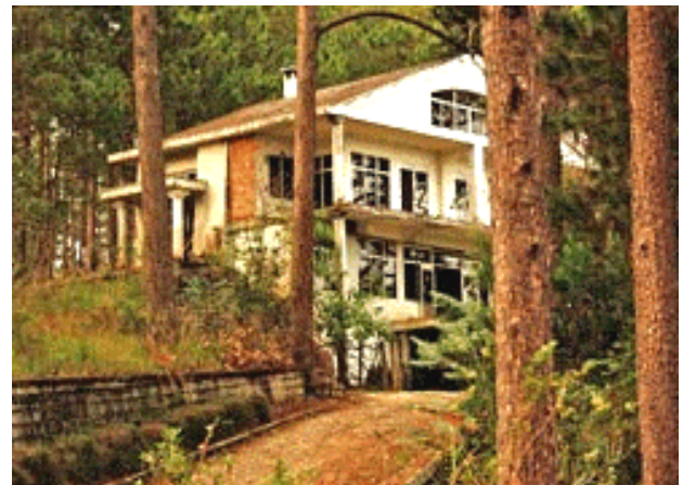
Một biệt thự ma tại Dalat

thanh vắng thường hiện hình để chải tóc dưới trăng và chọc ghẹo người đi đường (theo tài liệu của tintuc.timnhanh.com ). Nếu các bạn muốn tìm hiểu thêm về những ngôi biệt thự ma này, các bạn có thể xem một dvd mới được phát hành, với cái tựa "Ma Đà Lạt", của AV Production thực hiện và do Thanh Toàn diễn đọc.