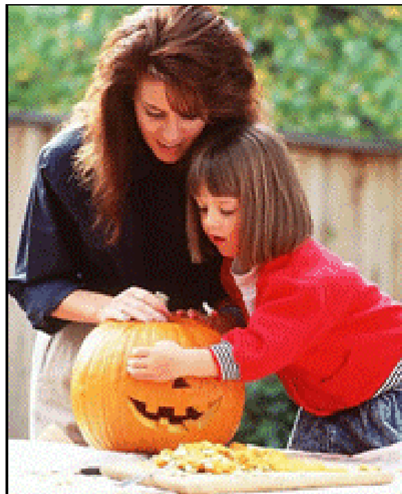
Quả Bí (Pumpkin) và nghệ thuật cắt đục (carving) trong dịp Halloween.

giới giữa hai cõi âm dương không rõ rệt, vong linh của những người khuất mặt trở về trần thế. Vì sợ hãi những hồn ma quấy phá, họ tụ họp lại, đốt lửa và bày những lễ vật để cúng thần linh. Trong khi làm lễ họ mặc những bộ đồ làm bằng dầu và da thú, một hình thức nguy trang để ma quỷ không nhận diện được và nhập vào thân xác họ.