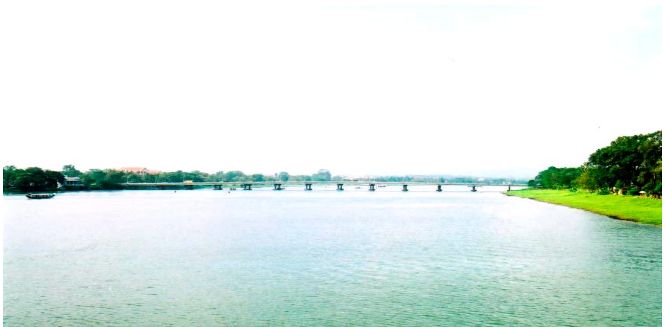
(Nhìn từ cầu Trường Tiền lên hướng Kim Long)

tuyệt đẹp của dòng Hương Giang kể từ cầu Trường Tiền đổ lên hướng Kim Long, chiếc cầu mới như một nét vẽ vụng về, ngang bướng, như một vết dao cắt đứt lia quá khứ thơ mộng trong tác lòng hoài cổ, những ai còn nặng tình với Huế.”