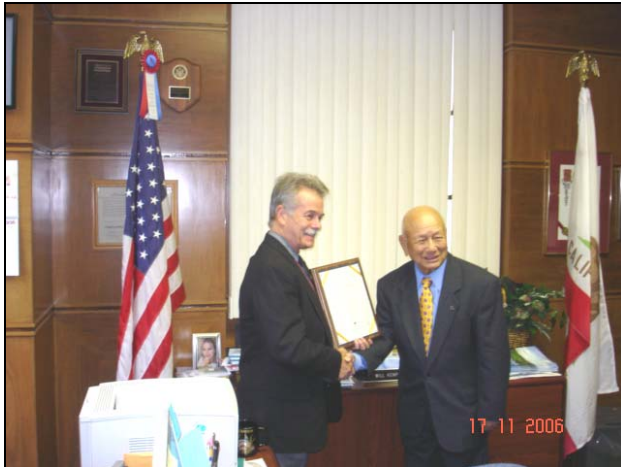
CERTIFICATE OF APPRECIATION by DIRECTOR CALTRANS