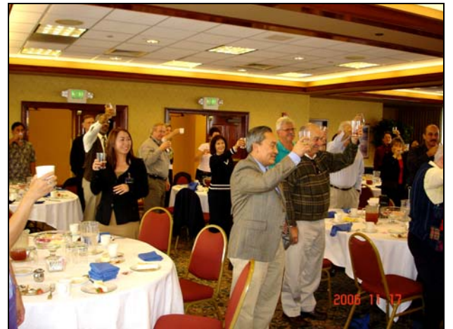
Các đồng nghiệp Caltrans nâng ly chúc mừng AH BHiệp