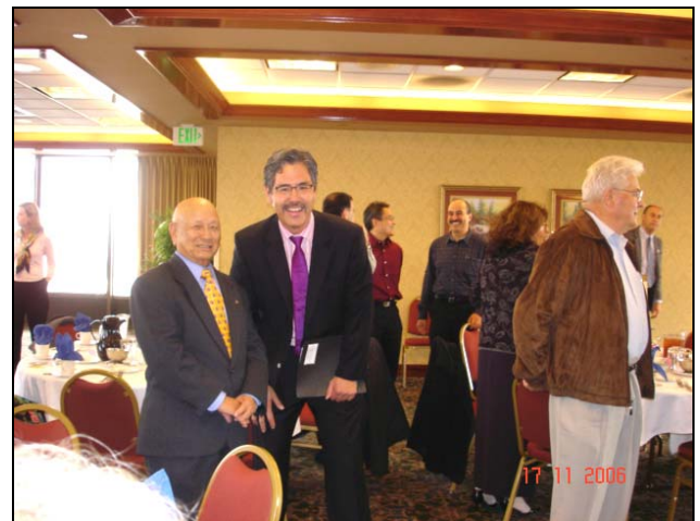
Ông Phó Giám đốc Caltrans cùng AH Bửu Hiệp