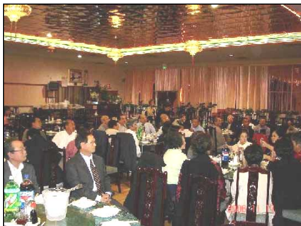
Tiệc mừng Về Hưu AHCC, cùng Ban Hữu tại Nhà Hàng Happy Garden