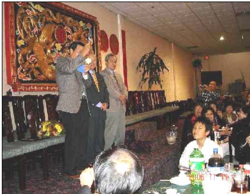
AH Khưu tông Giang trao HUY CHƯƠNG