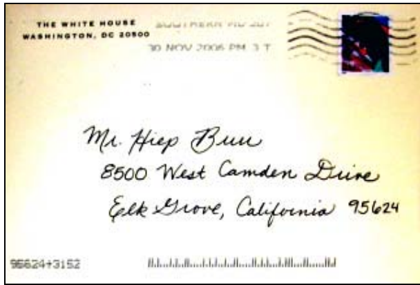
Thư chúc mừng & khen thưởng từ White House