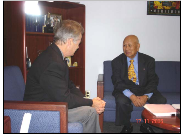
Ông Giám đốc Caltrans cùng AH Bửu Hiệp