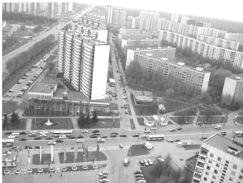
Moskva nhìn từ trên cao

độ Stalin như lao động khổ sai, chế độ hộ khẩu,