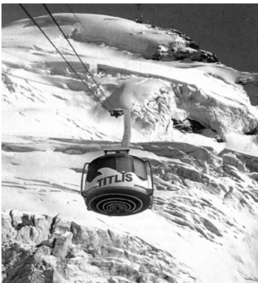
Cable car có thể xoay tròn đưa du khách lên đỉnh Titlis

Từ Lucern đi lên núi này chỉ 30 phút. Đường lên cao dần, hai bên cảnh trí tuyệt vời, cây cỏ xanh tươi, mây ngang đỉnh núi, khung cảnh tĩnh lặng. thỉnh thoảng lại có những chiếc dù bay lượn trong không gian của những người nhảy dù thể thao. Đường sá bắt đầu quanh co. Chúng tôi đang đi vào một con đèo nhỏ để lên cao dần. Đền lưng chừng núi là trạm Engelberg cao độ 1000 mét. Từ đây sẽ đi ba lần cable car vượt độ cao gần 2000 mét nữa để tới đỉnh núi. Trong chặng đầu tiên, nếu chú