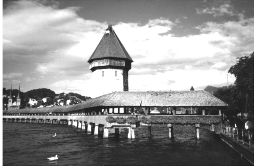
Cầu mái che

Ngày tiếp theo, sau khi ăn sáng, chúng tôi được đưa đi xem một biểu tượng khác của thành phố Lucern là