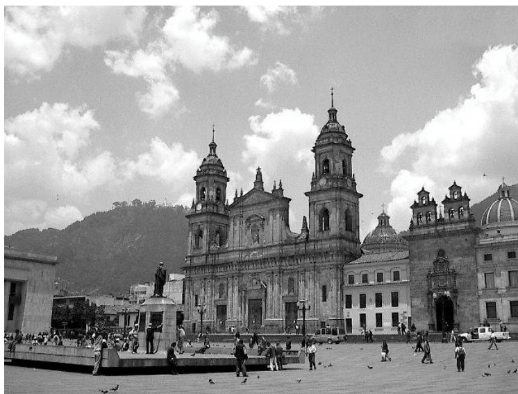
Một công trường ở thủ đô Bogota

-Liệu chính phủ có khả năng dẹp phiến quân không?