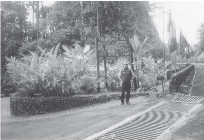
Công viên Quốc gia Rừng Nhiệt Đới/Aerial Tram độc nhất vô nhị ở Costa Rica