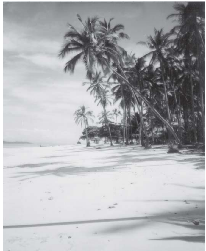
Đảo Tortuga/Đảo Rùa với khung cảnh hoang vắng không bóng người

Hai chúng tôi đã trở lại thủ đô San Jose trước khi lên máy bay trở về Hoa Kỳ. Đúng là ông bà ta xưa kia nói “đi một ngày, học được một sàng khôn”, thấy được những cái hay, cái lạ mà không nơi nào có được trên thế giới tại xứ Trung Mỹ này. Tuy cũng có vài điểm khi ảnh hưởng dẫn