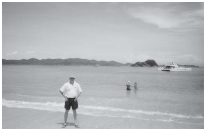
Trên Đảo Rùa/Tortuga với hai du khách đang thử nước biển sau lưng và xa xa là chiếc du thuyền Calypso đang bỏ neo bập bềnh trên sóng nước

cả thành phố. Mọi cửa hàng buôn bán đã đóng cửa sớm, có lẽ từ trước 9 giờ tối, phố xá thì lờ mờ dưới ánh đèn vàng u ám. Những sạp bán hàng rong dọc đường phố đều được vải bạt nylon che phủ kín và buộc dây sơ sài, chứng tỏ nạn trộm cắp đã không xảy ra ở xứ sở hiền hòa này, hai bên đường với cống rãnh đã được xây dựng rất thô sơ và tiêu điều từ nhiều chục năm về trước, và đã không được sửa chữa, thay đổi gì cả. Dân làm cầu đường mà có Job ở đây, kể như trúng mồi to, vì toàn bộ đường-xá, cầu-cống cần được mở rộng và sửa chữa, kể cả hệ thống cống rãnh và lề đường dành cho người đi bộ.