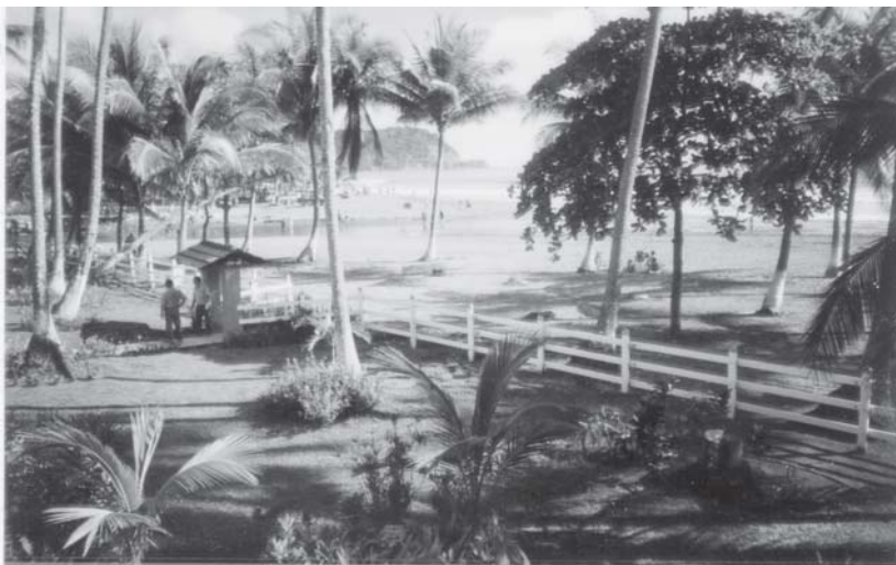
Cảnh bãi biển Jaco, mặt sau của khách sạn Tangerie, Costa Rica

Trên đường về, được biết mưa gió nhiều và đất đã lở đổ và ngăn chặn đường xe chạy nên chúng tôi phải đi vòng thêm 3 tiếng qua những đoạn đường núi ngoằn ngoèo, chật hẹp và nhân dịp đó chúng tôi đã được trông thấy vài ngọn thác nước cao lờ mờ từ xa trước khi trở về thành phố San Jose. Chúng tôi đã đi vào giấc ngủ thật ngon sau một chuyến hành trình dài 14 tiếng từ 7 giờ sáng đến 21:00 giờ tối.