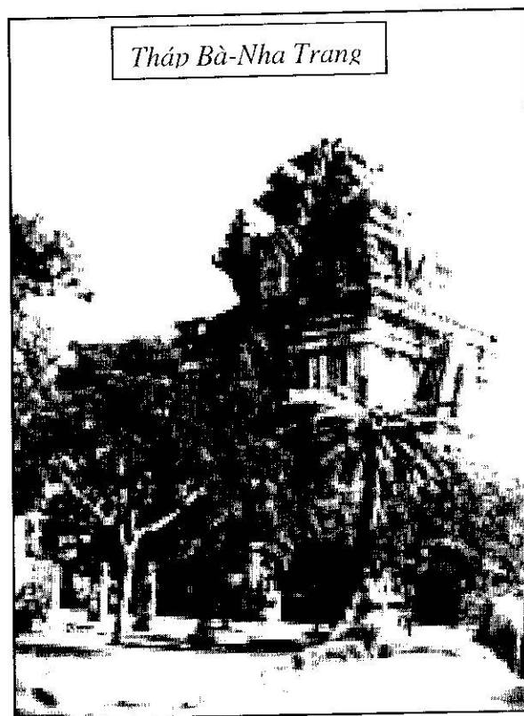
Tháp Bà-Nha Trang