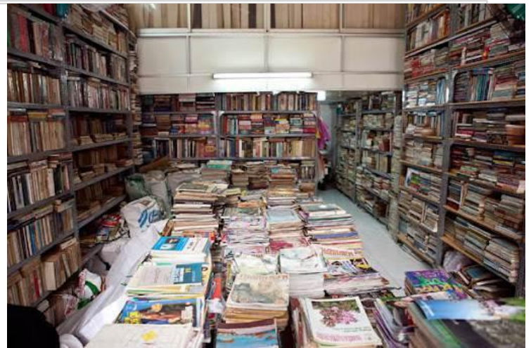
Phía trong của tiệm cho thuê sách Cảnh Hưng