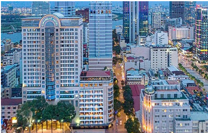
Khách sạn Caravelle ngày nay xây dựng mở rộng góc bên trái 24 tầng, tòa nhà xây dựng vào năm 1959 vẫn giữ nguyên (Ảnh: Internet)

Sau đó vào cuối thập niên 1970, các hãng truyền thông và truyền hình của Mỹ như CBS , ABC , New York Times và Washington Post đến đặt trụ sở tại đây. Trên tầng thượng có cả một câu lạc bộ họp mặt các nhà báo trao đổi thông tin với nhau mà nay nó được gọi là Saigon Bar .