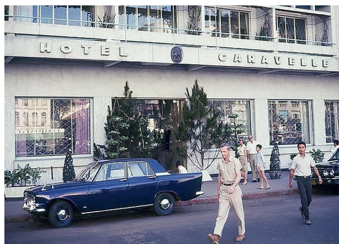
Khách sạn Caravelle nơi thường trú của các hãng truyền thông nước ngoài