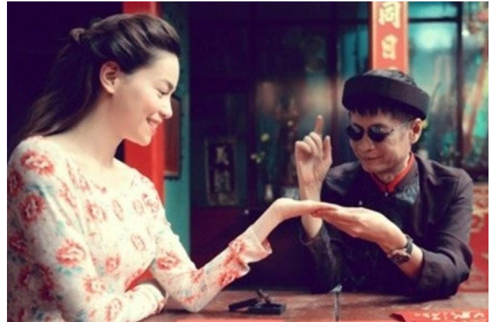
Xem chỉ tay

những lá số tử vi đầy bí ẩn đến những lá bài tây cũng có thể được các thầy nhìn vào đó để đoán “ quá khứ vị lai ”. Lòng tin của người xem bói được xác định qua những lời bàn của thầy, thế cho nên thầy nào càng có tài ăn nói thì càng... đông khách!