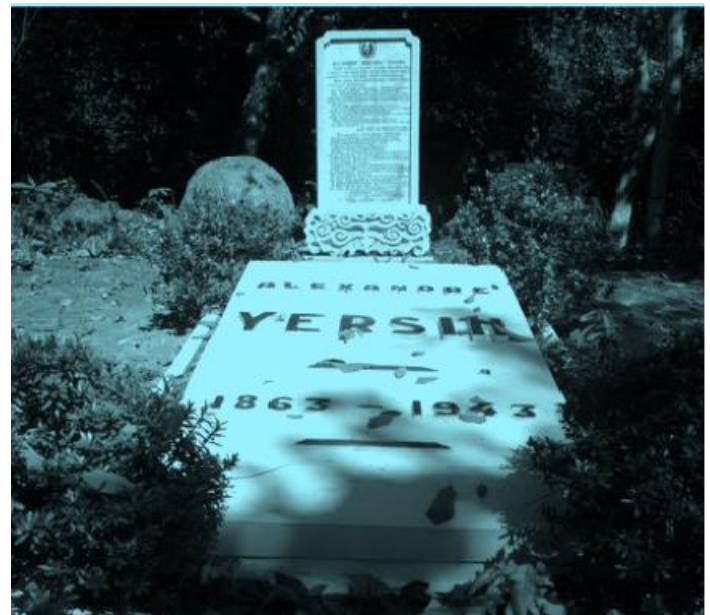
Lăng mộ thật đơn giản của vị bác sĩ lừng danh tại Nha Trang

Người dân khắp nơi yêu quý ông, nhất là người Hong Kong, nơi ông đã giúp hàng triệu người dân ở đây thoát khỏi nỗi kinh hoàng do dịch cúm. Úc từng mời ông sang thành lập viện Pasteur cho họ nhưng ông đã từ chối. Hong Kong thì tìm mọi cách giữ ông lại với điều kiện làm việc và bổng lộc hậu hĩnh, nhưng ông vẫn khẳng khái quay về dải đất hình chữ S mà ông trót yêu thương. Năm 1943, trí thức toàn thế giới, đặc biệt giới Y khoa và giới thám hiểm đã bày tỏ sự thương tiếc vô hạn về một tài năng, một nhân cách lớn lao của nhân loại, một trái tim nhân ái đã ngưng đập.