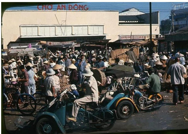
Chợ An Đông xưa