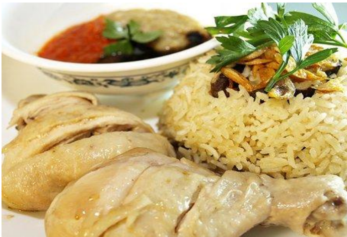
Cơm Gà Siu Siu

đường Nguyễn Duy Dương, cạnh trường Trí Dũng, và biến 3 căn này thành một nhà hàng bán cơm gà thật lớn, trong khi ông vẫn duy trì cái quán cóc nhỏ ở sát cạnh nhà mẹ tôi. Vẫn theo lời kể của chị Thạch, thì khi giải phóng, tất cả những nhà hàng lớn của Hoa kiều ở Chợ Lớn đều bị niêm phong và tịch thu, chỉ cho hoạt động những nhà hàng nhỏ bán buôn lẻ tẻ. Ông Siu Siu bỗng nhiên một lúc bị tước đoạt cả 3 căn nhà. Còn quán cóc thì ông sang lại cho chú Sáng, một người bà con của ông.