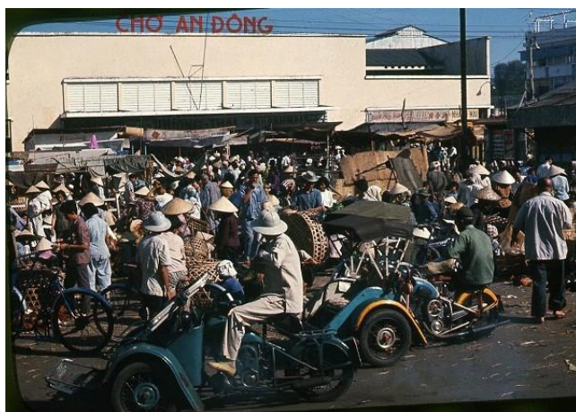
Chợ An Đông xưa