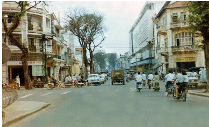
Thương xá Crystal Palace được xây dựng năm 1968

Thương xá Tam Đa có sáu tầng lầu với tổng diện tích 6.500m 2 , được xây dựng vào năm 1968, có tên là Crystal Palace. Đây là một khu thương mại đặc địa, tọa lạc trên khu đất được bao bọc bởi các trục đường Công Lý, Lê Lợi, Nguyễn Trung Trực và Lê Thánh Tôn tại quận 1. Khu thương mại này được thiết kế bởi kiến trúc sư tài năng bậc nhất trong lịch sử kiến trúc của Việt Nam là Ngô Viết Thụ ( Ghi chú của BPT: Có nhiều người cho biết KTS chính của đồ án này là Nguyễn Phúc Quỳnh Thuyền ).