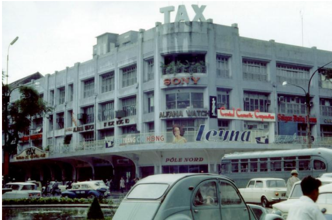
Thương xá TAX 1965

Tháng 10 năm 1925 tiệm bách hóa gắn thêm một hệ thống còi điện để kêu lên mỗi khi có tin mới từ chính quốc báo sang. Năm 1942 xây thêm lầu bốn, đập bỏ tháp đồng hồ và thay vào đó là bảng gắn dòng chữ GMC.