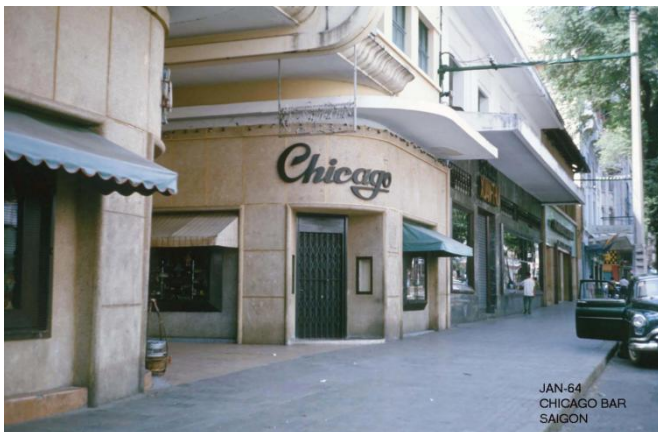
Thương xá Eden năm 1964 – Lối vào Cinema và Passage Eden trên đường Tự Do