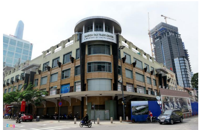
Thương xá TAX trước ngày bị đập bỏ (2016)

Năm 1998 tên Thương xá TAX được phục hồi, nhưng vào năm 2014 thì có lệnh giải tán Thương xá TAX với kế hoạch phá tòa nhà này đi để xây một cao ốc 40 tầng ở địa điểm trung tâm này. Ngày 12 tháng 10 năm 2016, công tác đập bỏ khu Thương xá được bắt đầu tiên hành.