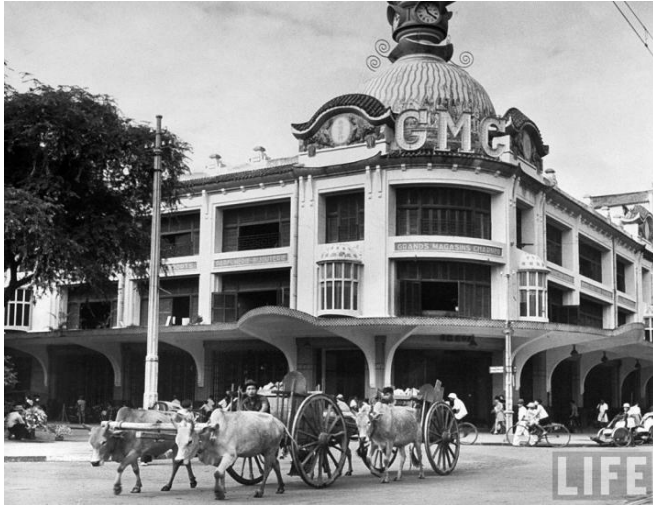
Thương xá TAX năm 1948 khi còn mang tên GMC

Tháng 10 năm 1925 tiệm bách hóa gắn thêm một hệ thống còi điện để kêu lên mỗi khi có tin mới từ chính quốc báo sang. Năm 1942 xây thêm lầu bốn, đập bỏ tháp đồng hồ và thay vào đó là bảng gắn dòng chữ GMC.