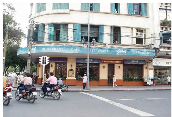
Thương xá Eden sau năm 1975

Quán La Pagode – được các văn nghệ sĩ gọi nôm na là quán “Cái Chùa” – dịch từ La Pagode – là điểm hẹn của những tên tuổi lừng lẫy trong giới văn nghệ bấy giờ như kịch tác gia Vũ Khắc Khoan; các nhà văn Mai Thảo, Thanh Nam, Nguyễn Đình Toàn; các nhà thơ Nguyễn Sa, Thanh Tâm Tuyền... Họ đến đây chủ yếu trò chuyện văn chương, hoặc có khi ngồi một mình nhâm nhi ly cà phê hay kêu chai bia 33 ngồi ngó mông lung ra đường, hoặc nhìn xéo qua ngã tư về phía nhà thờ Đức Bà là những vòm cổ thụ cao vút của Công viên Chi Lăng chênh chéch như một ngọn đồi. Mấy năm trước, những cổ thụ trong Công viên Chi Lăng đã bị chặt bỏ, công viên trở thành một khoảnh sân của trung tâm thương mại Vincom.