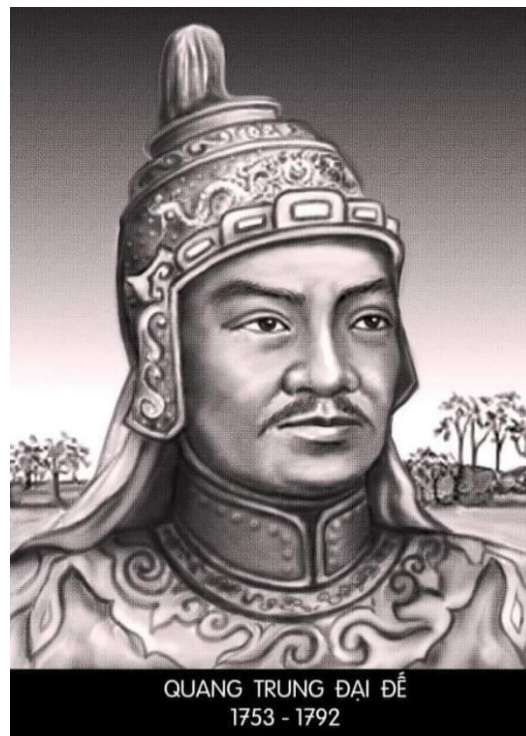
QUANG TRUNG ĐẠI ĐẾ 1753 - 1792

Các tướng đem binh đuổi đánh quân nhà Thanh đến tận cửa Nam Quan. Người dân Tàu ở gần Lạng Sơn khiếp sợ, đàn ông, đàn bà dắt díu nhau mà chạy, từ cửa ải về mé bắc hơn mấy trăm dặm, tịnh không nghe thấy tiếng một người nào.