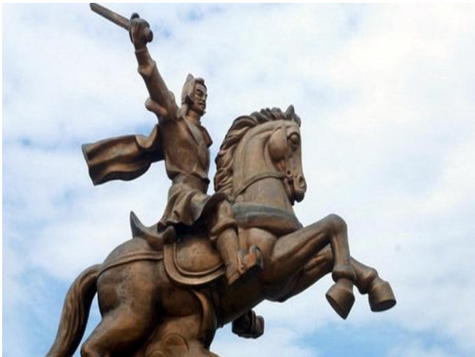
Tượng vua Quang Trung tại tỉnh Bình Định

trong nước, nửa theo đảng nọ, nửa theo đảng kia, thì Nguyễn Huệ tất không chịu lui. Vậy ta hãy đưa thư sang tỏ bảo đường họa phúc xem nó đối đáp làm sao. Đợi khi nào thủy quân ở Môn, Quảng đi đường bể sang đánh mặt Thuận Hóa và Quảng Nam rồi, bộ binh sẽ tiến lên sau. Nguyễn Huệ trước sau bị địch, thế tất phải chịu thua. Bấy giờ ta sẽ nhân mà làm ơn cho cả hai bên; từ đất Thuận Hóa Quảng Nam trở vào Nam, thì cho Nguyễn Huệ; từ châu Hoan, châu Ái trở ra Bắc thì phong cho Tự quân nhà Lê. Ta đóng đại binh lại để kiềm chế cả hai bên, rồi sẽ có xử trí về sau".