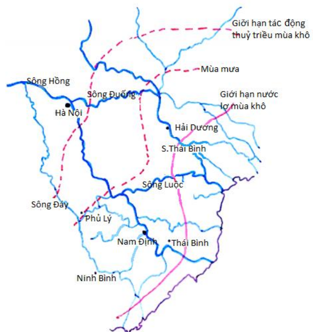
Hình 2: Châu thổ sông Hồng: các sông chính và ảnh hưởng thủy triều, Tỷ lệ: 1: 1,000,000

sông Hồng về mùa lũ có màu đỏ-hồng với lượng phù sa của sông Hồng rất lớn, trung bình khoảng 100 triệu tấn trên năm tức là gần 1.5 kg phù sa trên một mét khối nước. Phù sa vừa giúp cho châu thổ màu mỡ và mở rộng tiến dần ra biển nhưng đồng thời cũng làm lòng sông bị lấp đầy khiến cho lũ lụt xảy ra và vì vậy phải có đắp đê hai bên sông để tránh lũ lụt. Mà nạn vỡ đê thì dễ, lũ lụt phá hại mùa màng, kéo theo bao nhiêu người chết, như trong truyện ngắn cảm động Anh phải sống của nhà văn Khái Hưng : người vợ bị cuốn theo dòng nước lũ nhưng dặn chồng Anh phải sống để nuôi đàn con thơ dại.