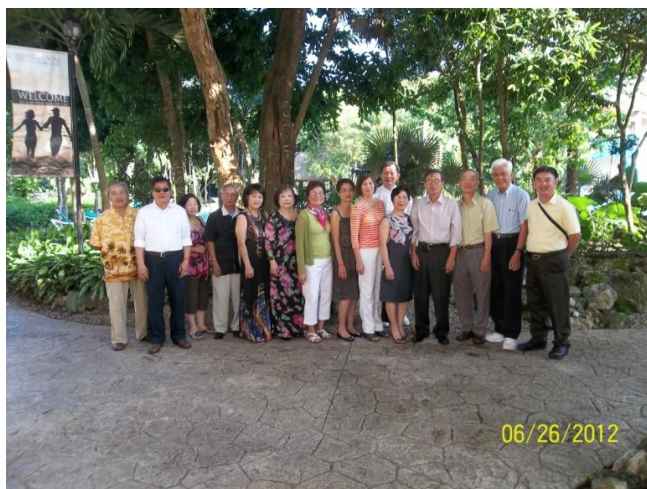
Khóa 6 KSCC tổ chức kỷ niệm 45 năm ra trường ở Cancun, Mê Tây Cơ, bạn Các phía ngoài tay phải

DC và thuê nhà ở đó. Bạn có một căn nhà khá lớn ở Harrisburg, Pennsylvania, để cho vợ và vợ chồng cô con gái ở. Bạn đã đón chúng tôi về chỗ trọ, nhường phòng ngủ cho chúng tôi và chở chúng tôi đi thăm hoa anh đào và các thắng cảnh của Thủ Đô Hoa Thịnh Đốn. Trong khi đi chơi và trên đường về nhà, bạn đã kể cho tôi biết tất cả những gì bạn đã làm để che mắt VC và lập chuyến vượt biên thật hải hùng, nhưng thành công. Tôi không ngờ tôi có một người bạn giỏi giang như vậy. Bạn đã uống rượu và đấu trí với tụi VC. Khi vượt biên, bạn đã tổ chức thật qui củ, mua địa bàn, hướng dẫn người lái tàu đến bờ Tự Do. Tôi nghĩ nếu tôi còn kẹt lại VN, tôi không được như bạn, học hỏi và làm được như vậy.