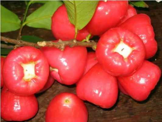
Trái mận đỏ

này hay ngắm cây lý nên khi trái đã chín thì Má tôi hay biểu và họ nhận một cách rất là vui vẻ. Cây đu đủ lùn, cây xoài, cây mận ngọt, cây vú sữa cũng được trồng ở đó. Bên hông nhà và sân sau thì ba má trồng chùm ruột, ổi xá lị, mận loại trắng và dứa. Tôi hay ngồi vắt vẻo trên cây mận trắng sau nhà vừa ăn mận vừa hưởng thú trèo cây.