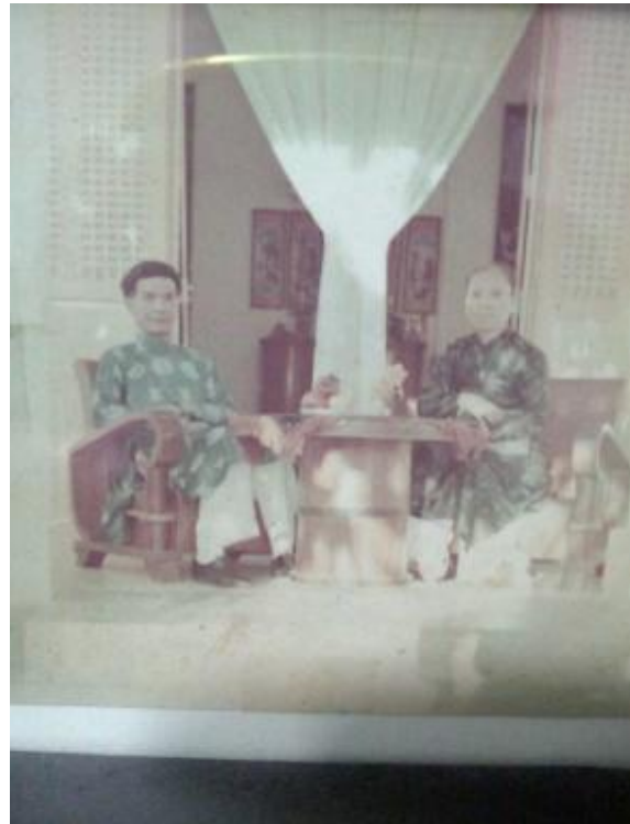
Hình ba má của TN

mờ, bé nhỏ núp sau những ngôi sáng nhưng vẫn được khám phá ra tuy rất muộn thì không phải là đáng mừng lắm sao?