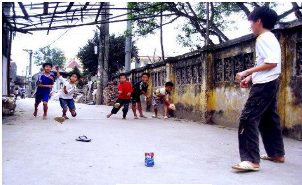
Trò chơi tạt lon

là lúc mình tạt trúng cái lon hay lúc người giữ lon tìm cách rượt bắt mình. Nếu bị bắt thì người tạt lon sẽ trở thành người giữ lon và cứ thế mà trò chơi cứ tiếp diễn nên lúc nào cũng có tiếng la, tiếng cười.