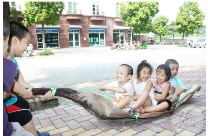
Kéo mo cau

thì sẽ hiểu chữ “Đốc Quân” từ đâu mà ra. Đó là vì cậu năm là hiệu trưởng của trường tiểu học Trần Minh Quân mà người địa phương gọi tắt là trường “Trần Minh”. Sau này trường được đổi tên là Mỹ Phước cho mãi đến năm 1975. Sau 1975 thì khu trường Mỹ Phước được chia làm hai trường: Trường tiểu học Châu Văn Liêm và trung học đệ nhất cấp Nguyễn Trãi.