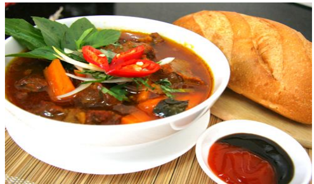
Hủ tiếu bò kho-Món ba tôi ưa thích nhất

Nhờ trời thương từ từ ba tôi bỏ được thuốc chống đau và trở lại cuộc sống bình thường nhưng vẫn hơi yếu nên có lúc phải chống gậy. Má và chúng tôi mừng khôn xiết. Cũng vào thời điểm này thì chị sáu Liêng đã đến tuổi trở mã và được nhiều người để ý, xin đến nhà thăm. Má chúng tôi rất cấp tiến nên chuyện đến nhà chơi thì cụ vui vẻ cho phép. Riêng ba tôi thì cho là con trai mà đến nhà con gái rồi rề rà ở đó là không tốt nên cụ hay chống cây gậy đi từ nhà giữa ra phòng khách, lượn tới, lượn lui vài vòng là mọi người hiểu ý nên mạnh ai nấy lo kiếm đường mà chạy.