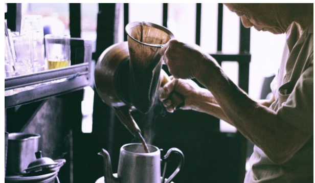
Cách pha chế cafe kiểu xưa.

danh học thêm ở trường đại học tại Long Xuyên mà lúc đó gọi là Đại Học Hoà Hảo và thầy Tường là giáo sư thỉnh giảng. Khi tôi hỏi thầy ấy còn nhớ ông giáo Lâm Bình Cơ không thì thầy nhận ra liền và muốn đến thăm ba. Tôi nói ba đã qua đời nhưng còn má. Thầy vội vã đến thăm má chúng tôi ngày hôm sau. Điều này cho thấy tinh thần “Tôn sư trọng đạo” của những người xưa như thế nào rồi.