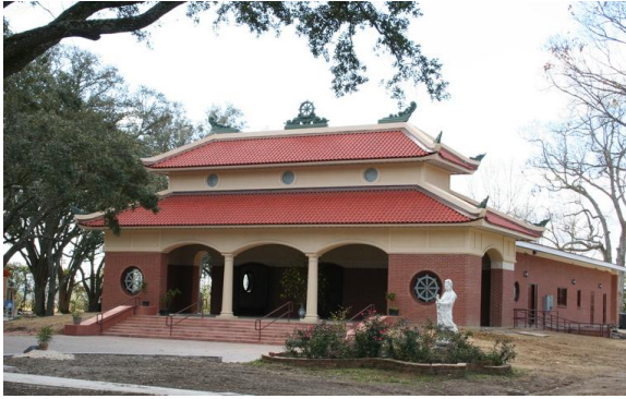
Chùa Tam Bảo ở Baton Rouge