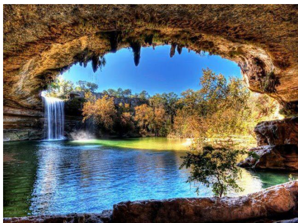
Hamilton Pool Preserve, Austin, Texas

BPT chúc AH Hợp luôn khỏe mạnh để tận dụng bất cứ thời giờ rảnh hay tiền bạc để giúp những người thiếu thốn. Một gương sáng cho các AHCC.