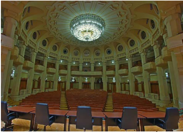
Một phòng họp trong tòa nhà quốc hội Romania

Tòa nhà nằm trên đồi cao. Từ tòa nhà này nhìn xuống đại lộ Urini thì đẹp lắm. Người ta dự định có chỗ để cho ông Ceausescu xuất hiện mỗi khi có hội họp quần chúng. Sau này chỗ đó lại là nơi ca sĩ Micheal Jackson chào khán giả trong một chuyến lưu diễn ở đây. Tức cười là lúc đó anh ta nói: “Hello Budapest” thay vì “Hello Bucharest”. Nhiều người cũng lẫn lộn như vậy. Thật ra Budapest là thủ đô Hungary. Bucharest ở đây là thủ đô Romania. Do bắt đầu bằng chữ Bu... giống nhau nên nhiều người lẫn lộn.