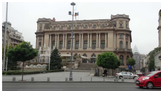
Một kiến trúc đẹp ở thủ đô Bucharest – Romania.

tiệm bán hoa vì dân Romania rất thích tặng hoa cho nhau.