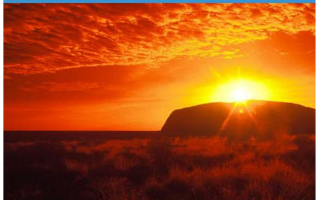
Hình nổi tiếng lúc mặt trời lặn tại đây rất hùng vĩ.