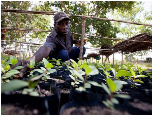
Ai cũng phải tranh đấu để có điều kiện trồng trọt nhất là nước tưới cây

thủy điện, dẫn thủy nhập điền, xây dựng khu gia cư, tăng gia du lịch... tóm lại, là để có rất nhiều điều lợi : Ích quốc (Quốc gia ở thượng lưu con sông) và lợi dân (Những người dân sống bên hồ nước, những người buôn bán nhà đất và khai thác du lịch) . Tuy nhiên, lợi cho đám người này mà lại là hại cho đám người khác, những người sống dọc theo hạ lưu con sông, như : Thiếu mất phù sa; nước mặn ngoài biển tràn vào, làm hư hại hoa màu, thiếu vắng tôm cá v.v...Nếu đám người thua thiệt này lại nằm ngoài ranh giới quốc gia thượng nguồn, thì những cái “ hại ” đó càng dễ bị ngó lơ.