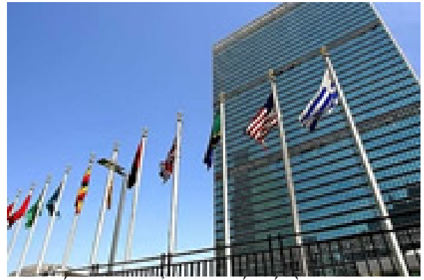
Các quốc gia trong Ủy Ban Quốc Tế về Đập

Không cần nói đâu xa, ngay ở Việt Nam ta, trước năm 1975, dân làng An Thái, thuộc tỉnh Bình Định, đã nổi tiếng là giỏi võ, cũng vì cha ông họ, nhiều đời trước, đã phải tranh đấu với các làng thượng nguồn của con sông Côn, để giành nước tưới ruộng.