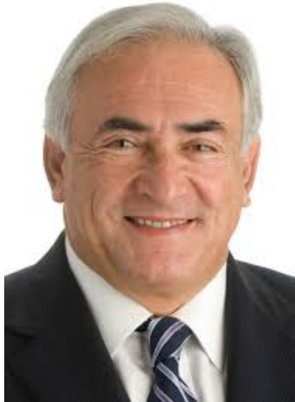
Dominique Gaston André Strauss-Kahn aka DSK - Managing Director of the International Monetary Fund

Ngày 9/7/15, theo đài Fox News, Thủ Tướng Hi Lạp Tsipras đã đệ nộp lên các « chủ nợ» một chương trình giải cứu, trợ giúp tài chánh cho Hi Lạp (HL) thêm một số tiền vay là 60 tỷ €, đồng thời giảm bớt tổng số đã nợ. Đề nghị này đã được Quốc Hội HL chấp thuận với tỷ lệ 251 phiếu thuận trên tổng số 300 dân biểu. Nó chứng tỏ chính quyền HL đã cố gắng theo điều kiện đặt ra bởi các chủ nợ, mặc dầu trước đó vài ngày dân chúng HL đã «không»