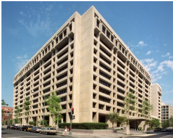
Hình trụ sở của IMF tại Washington D.C., USA

*Cầm quyền trong 4 năm, đã giải quyết một số vụ như : thuyết phục được các nước Âu Châu cho Hi-Lạp vay nhiều tỷ Euros năm 2010 để tháo gỡ khó khăn của nền kinh tế; áp đặt Hi Lạp và các nước đi vay IMF phải áp dụng các biện pháp “thắt lưng buộc bụng” (bớt công chức, giảm công chi kể cả tiền hưu trí, giảm thiểu an sinh xã hội, bớt phúc lợi về y tế, tăng thời gian làm việc,...) mặc dầu DSK là một đảng viên của đảng xã hội Pháp, nhưng những biện pháp của IMF trong thời kỳ này lại ngược lại với chủ trương xã hội, nghiêng về phía tư bản tài phiệt, kể cả chống lại đề nghị đánh thuế các thương vụ tài chính quốc tế (thuế Tobin) nhằm điều tiết và giữ tỷ lệ hối đoái không đột biến.