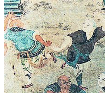
Hình vẽ trên tường chùa Thiếu Lâm

Dịch cân kinh ( chữ Hán : 易筋經; nghĩa là "cuốn kinh chỉ phép co duỗi gân"), có nơi gọi là Dịch cân tẩy tủy kinh hay Đạt Ma dịch cân kinh , là một cuốn sách võ thuật dạy cách thở nạp chân khí , nhằm cường thân kiện thể, trường sinh .