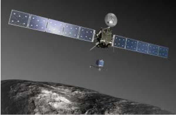
Rosetta Space Craft

1/ Vì thấy lt số 104 hơi mỏng nên xin góp một chuyện ngắn .