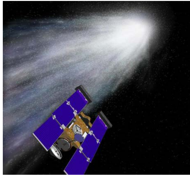
Artists concept of the stardust spacecraft flying through the gas and dust from comet Wild 2.

4/ Cái đuôi sao chổi mà tôi được nhìn thấy vào khoảng năm 1942-1943 cũng có đuôi cong chứ không thẳng tắp như khói thoát ra từ đuôi máy bay phản lực, trái với sao chổi Churyumov-Gerasimenko (67P) cũng gây nên một thắc mắc của tôi: vì sao đuôi sao chổi có cái cong, có cái thẳng?